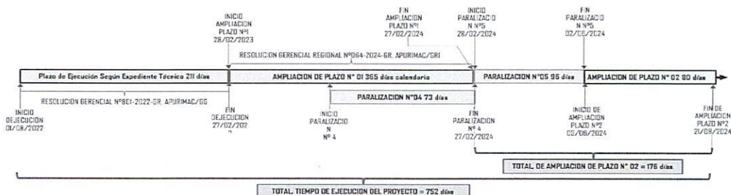
Imagen N° 01: Línea de Tiempo de plazo de ejecución

Nota: Los días solicitados de AMPLIACION DE PLAZO N°02 de los 176 días calendarios son por la Paralización N°04 + Precipitaciones Pluviales + Paralización fuera de plazo de ejecución.