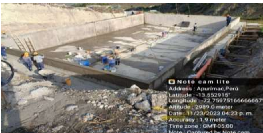
FIGURA 2. Trabajos de tarrajeo en el reservorio de Alameda.