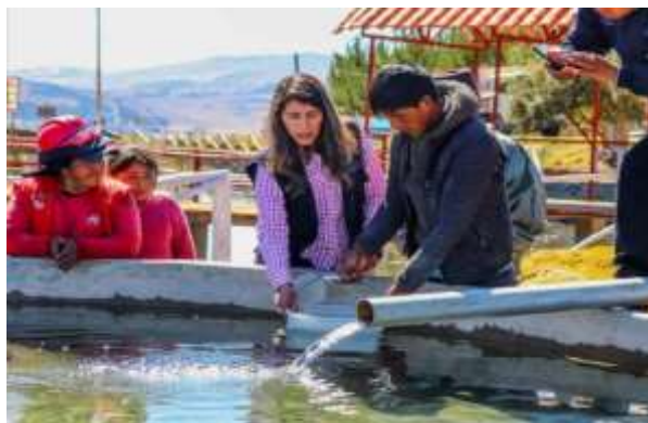
Estabulación de Ovas Embrionadas de Trucha – Producción de Alevinos de Truchas