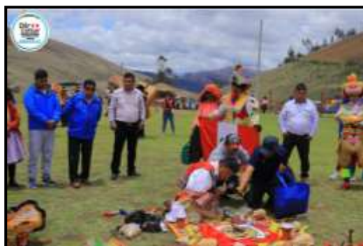
Gran encuentro Nacional de Danzas