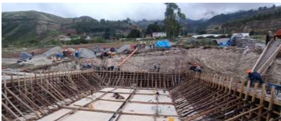
FIGURA 1. Trabajos de vaciado con concreto fc=210 kg/cm 2 en muro de reservorio sector Alameda