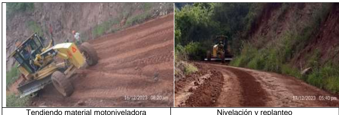
Tendiendo material motoniveladora