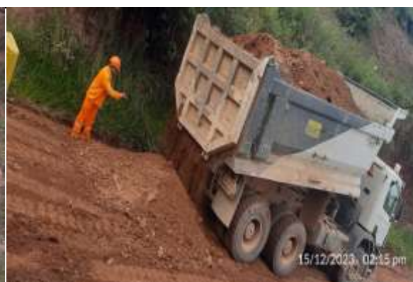
Transporte de material