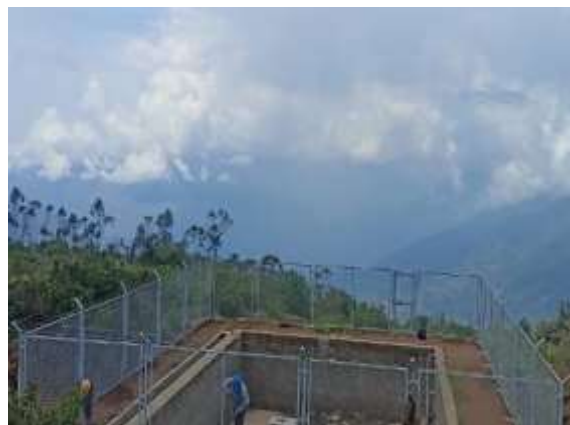
Imagen 2: Traslado de fierros al sector de reservorio Lambraspuquio