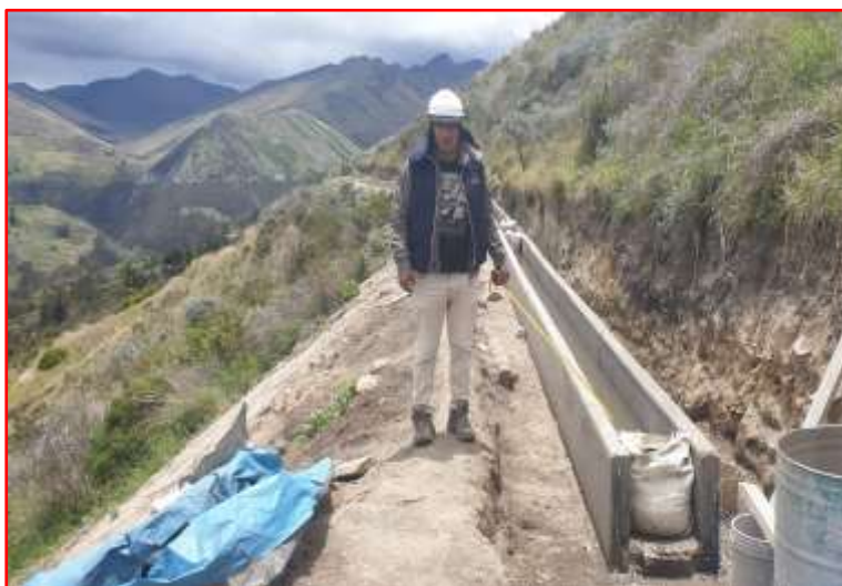
Imagen N° 02: Final de Actividades del Canal de Conducción en Progresiva 5 + 200 por cierre del año fiscal.