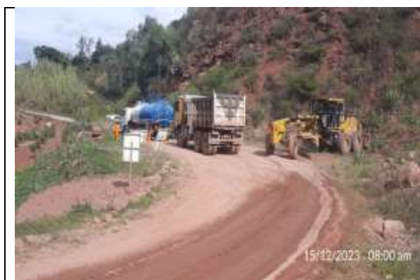
Movilización de maquinarias