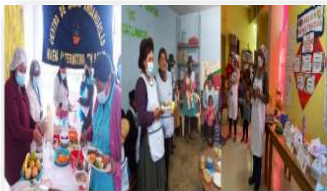
Sesiones demostrativas de preparación de alimentos C.S. Andahuaylas, Huancabamba, Chicmo