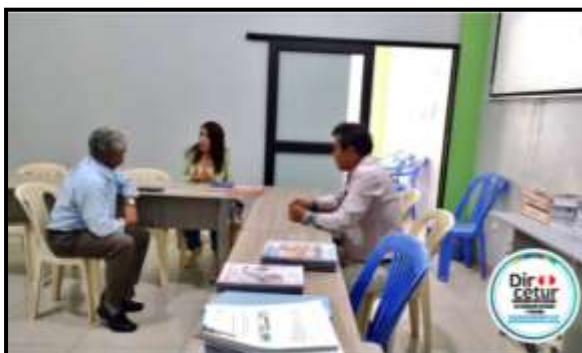
Reunión Directora de DIRCETUR Apurímac, y Presidente de la Cámara de Comercio exterior.