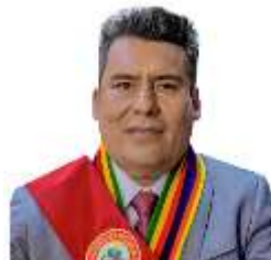
PERCY GODOY MEDINA Gobernador Regional

En cumplimiento al mandato del artículo 21, literal m) de la Ley 27867, Ley Orgánica de Gobiernos Regionales, el Gobierno Regional de Apurímac, a través de la Sub Gerencia de Planeamiento y Acondicionamiento Territorial de la Gerencia Regional de Planeamiento, Presupuesto y Acondicionamiento Territorial ha elaborado la Memoria Anual Institucional correspondiente al periodo 2023, con la finalidad de presentar y publicar los resultados de la gestión acorde con la misión institucional, el mismo que ha estado orientado a alcanzar los objetivos y metas institucionales planteados para contribuir la imagen del territorio deseado - visión regional, en el cual los funcionarios y servidores públicos han contribuido con su trabajo y esfuerzo para el cumplimiento de los programas y proyectos, las mismas que han tenido un impacto directo e indirecto en los objetivos territoriales del PDRC.