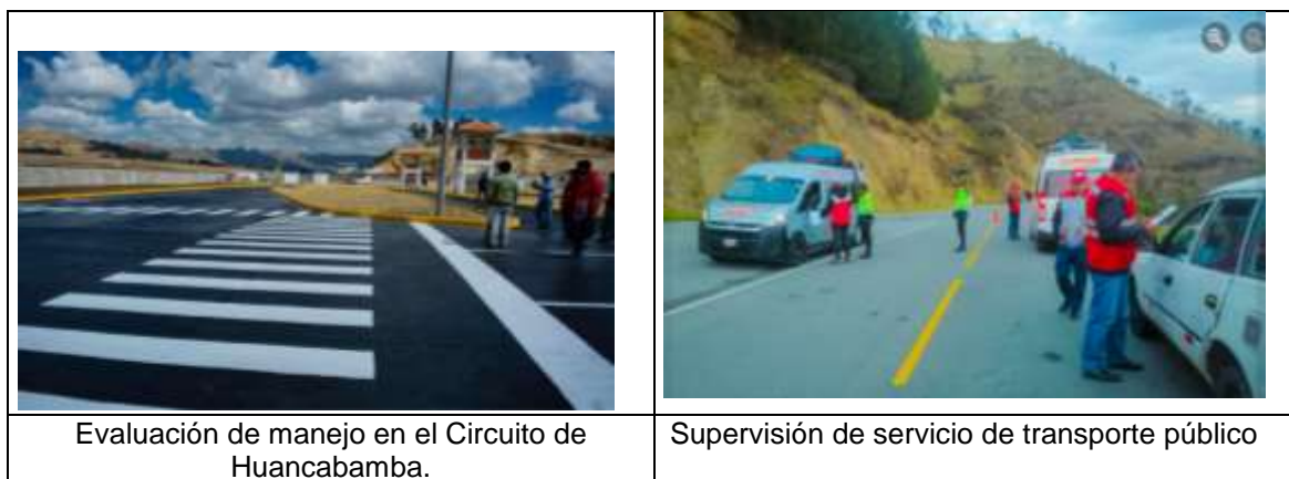
Evaluación de manejo en el Circuito de Huancabamba.