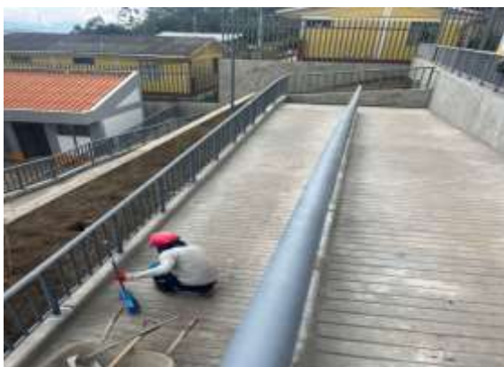
excavación de plataforma.