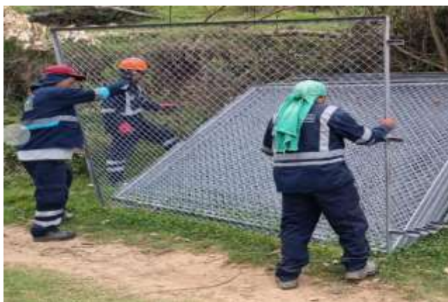
Imagen 2: Traslado de fierros al sector de reservorio Lambraspuquio