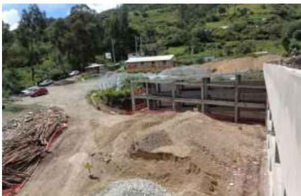
Construcción de rampa de acceso