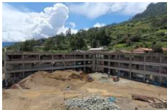
Se muestra la construcción del bloque 8, 9, 10 (nivel secundario)