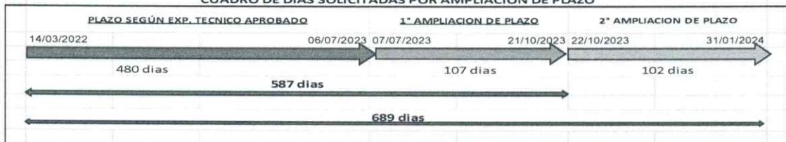
CUADRO N° 08