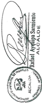
Rafael Ayqupa Sarmiento ALCALDE